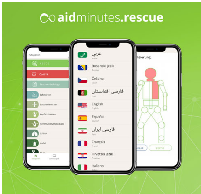
Abbildung 2 Auswahl unterstützter Sprachen aidminutes.rescue